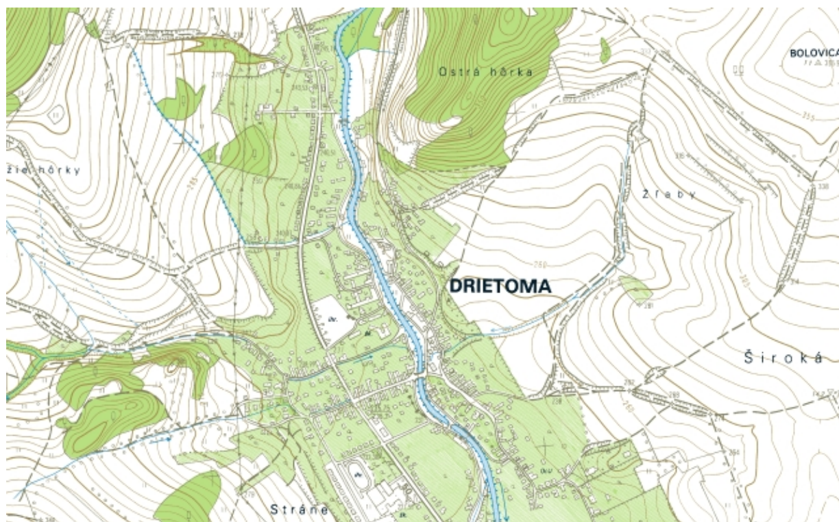
Obrázok 2 Ukážka Základnej mapy Slovenskej republiky 1 : 10 000