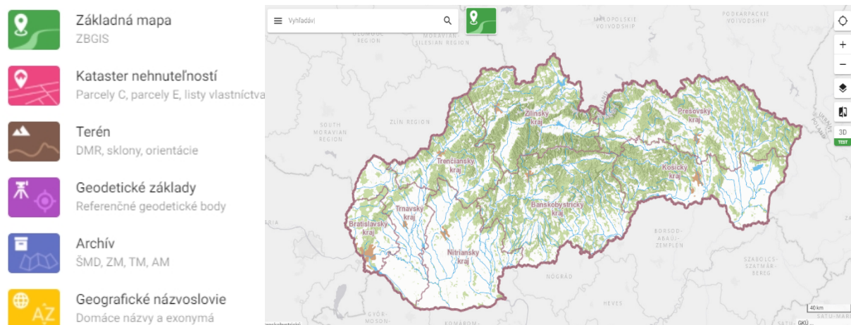
Obrázok 1 Aplikácia Mapový klient ZBGIS®

Téma Terén prináša digitálny model reliéfu a digitálny model povrchu SR, sklony terénu, orientácie voči svetovým stranám, informácie o nadmorskej výške.