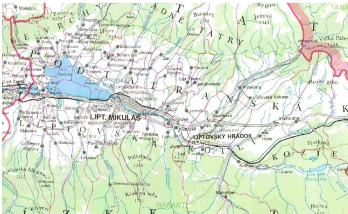
Obrázok 3 Ukážka Mapy krajov SR 1 : 200 000 – Žilinský kraj